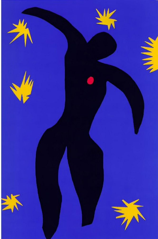
Henri Matisse Ikar

Temat: Które mity i dlaczego są szczególnie popularne w kulturze? Odpowiedz na pytanie na podstawie interpretacji obrazu i wybranych tekstów literackich.