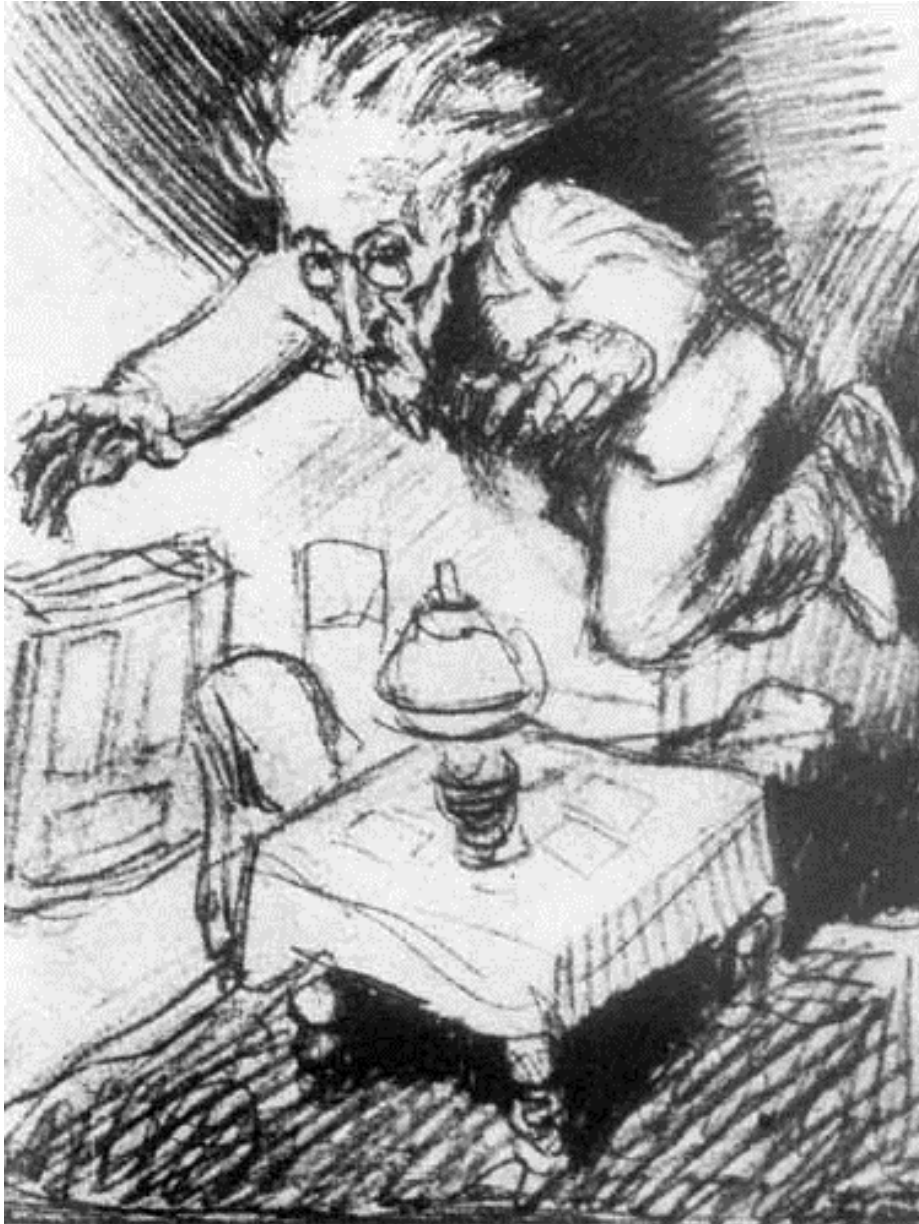
[Ojciec leżący nad stołem], 1935

Temat: Jak twórcy kultury przedstawiają inność ludzi? W odpowiedzi nawiąż do grafiki Brunona Schulza i dwóch tekstów literackich.