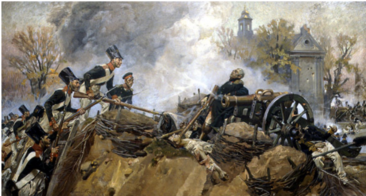
Juliusz Kossak, Sowiński na szanłcach

Temat: Jakie rozumienie patriotyzmu przedstawiają teksty kultury różnych epok? Omów zagadnienie, odwołując się do obrazu Wojciecha Kossaka oraz wybranych tekstów literackich.